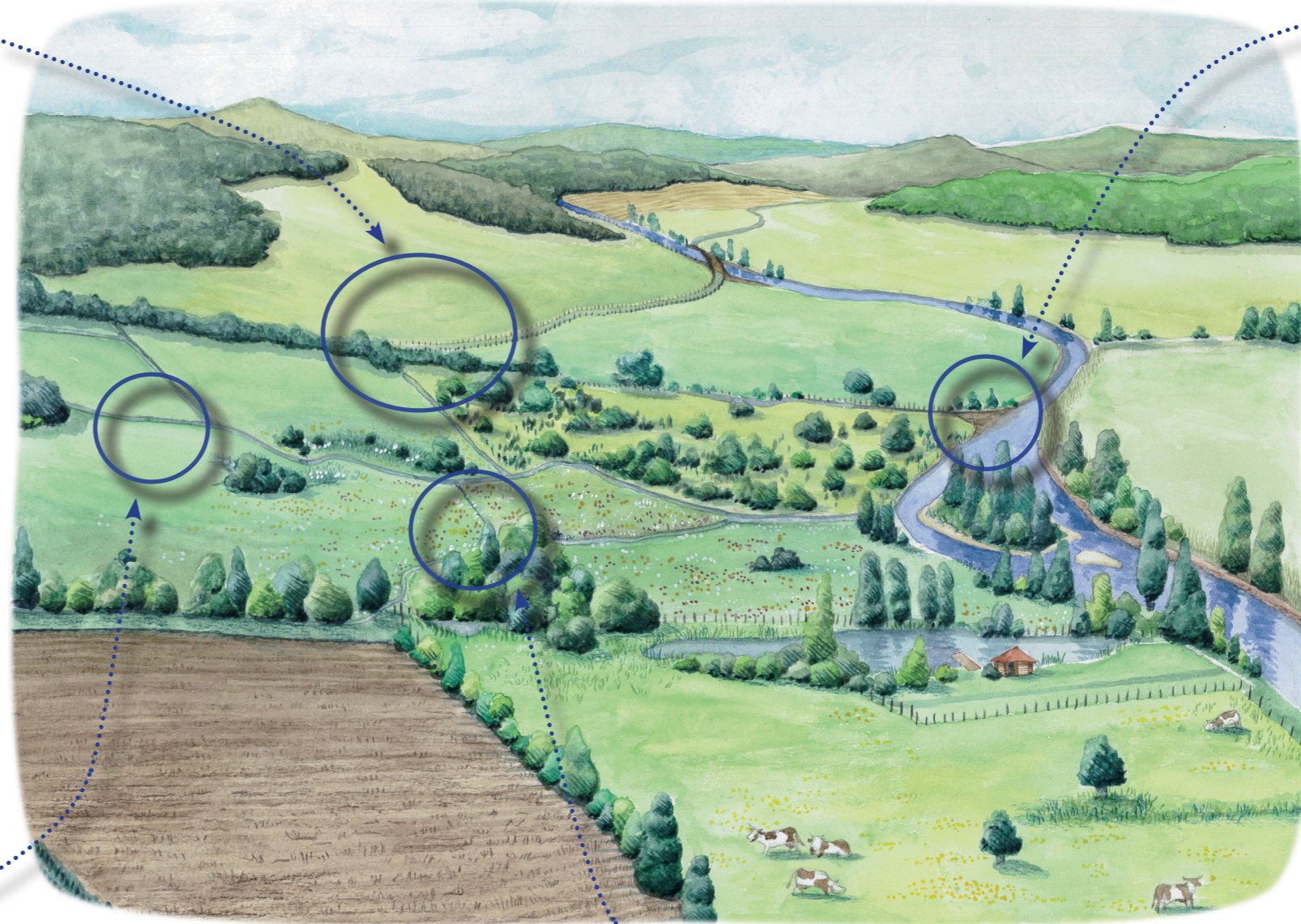
Exemple de ruisseau curé de manière intensive et surcréusé. L'habitat de l'agrion de Mercure a ainsi été détruit.