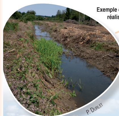
Exemple de travaux de restauration sur le marais du Châtelet réalisés par le Parc Naturel Régional du Haut-Jura.

Le reméandrement des ruisseaux recalibrés et l'adoucissement des berges trop encaissées sont susceptibles de favoriser le maintien ou de permettre l'augmentation des effectifs de certaines populations, ainsi que la recolonisation progressive de linéaires dépeuplés. En outre, la restauration de ces milieux aquatiques permet de gagner en linéaire de cours d'eau et de retrouver de nouveaux biotopes naturels reconstitués favorables à l'espèce. De plus, ces actions permettent de préserver la qualité de l'eau et du substrat de manière durable, tout en favorisant une multitude d'espèces (autres insectes, poissons...). Pourquoi s'en priver ?