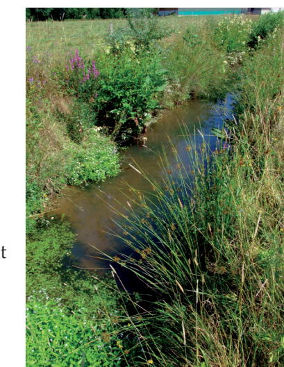
Fossé agricole accueillant l'agrion de Mercure