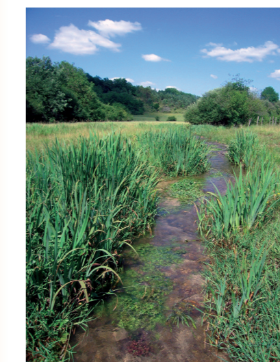
Ruisseau favorable à l'agrion de Mercure